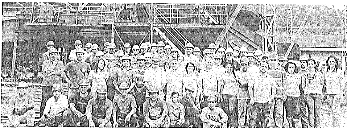
Imagen del Consorcio Cooperativo Agroatirro, R.L.